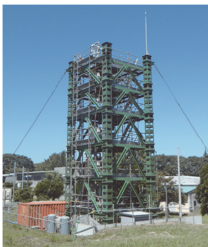
循環流動層コールドモデル